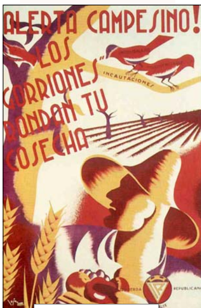
Cartel de IR. c. 1937

TODOS los asistentes al encuentro coincidieron en la necesidad de emprender una ofensiva conjunta para concienciar al Ejecutivo y la sociedad de la necesidad de establecer una Renta mínima. Por su parte, Joan Tardà y Carme Porta recordaron que esta propuesta es una muestra de los valores republicanos con los que Esquerra tratará de impregnar al Ejecutivo en la presente legislatura.