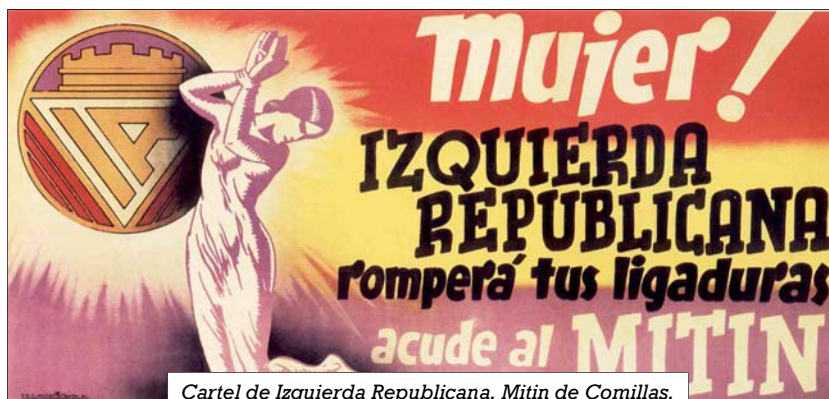
Cartel de Izquierda Republicana. Mitin de Comillas,

1. Orientación del Sistema Educativo, desde los primeros niveles académicos, reforzando la enseñanza en los valores de convivencia e igualdad entre el hombre y la mujer, acabando de una vez con los rancios estereotipos machistas que aún perduran en nues-