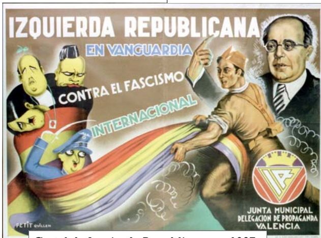
Cartel de Izquierda Republicana. c. 1937