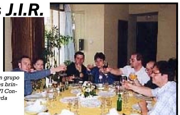
A la derecha, un grupo de las Juventudes brindando tras el XVI Congreso de Izquierda Republicana.

miendas, tanto individuales como colectivas. También se elegirá la Ejecutiva Federal de las JIR, que estará formada por jóvenes de todas las Federaciones.